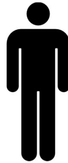
GRUPO 1 Ranitidina