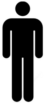
GRUPO 1 Aloe vera